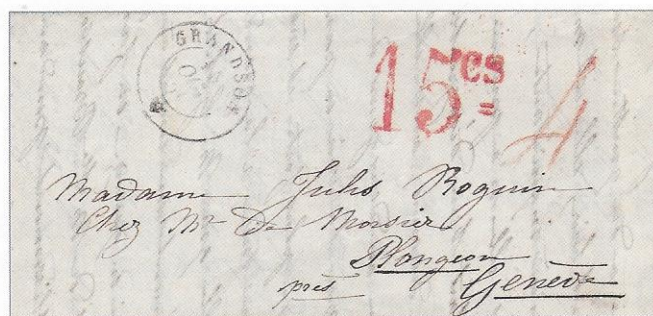
Illustration 2. Pli de Grandson à Genève, 1 er échelon de poids \leq \frac{1}{2} Loth et 2 e rayon 48 à 120 km. Ce pli a été envoyé le 10 octobre 1850. Il a été taxé à Grandson en ancienne monnaie soit 4 kreuzers, à Genève ce pli a été taxé en monnaie de Genève soit 15 cts. (1 kreuzer = 2,5 cts, 4 kreuzers = 10 cts en 1850. Le franc de Genève valait 1,43 franc suisse de 1850, soit 10 cts x 1.43 = 14,3 cts qui ont été arrondis à 15 cts).

enfin acceptée par le Parlement: «Cinq grammes d'argent, au titre de neuf dixièmes d'argent fin, constituent l'unité monétaire suisse, et portent le nom de franc.»*