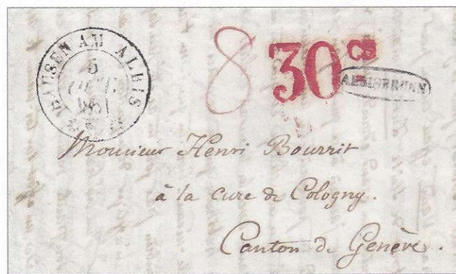
Illustration 3. Pli expédié d'Albisbrunn, puis Hausen am Albis (ZH) 5 OCT. 1851, la lettre est encore taxée au départ dans l'ancienne monnaie cantonale, c.-à-d. en kreuzers. A son arrivée à Genève la poste taxe correctement ce pli provenant du 4 e rayon tarifaire, 1 er échelon de poids \leq \frac{1}{2} Loth, soit 30 cts de Genève payés par le destinataire. 1 kreuzer = 2,5 cts, 8 kreuzers = 20 cts (cf. légende de l'illustration 2).

En dehors de ces exceptions genevoises, durant les années 1850 et 1851, le courrier non affranchi était taxé en ancienne monnaie (kreuzer). L'habitude de ne pas affranchir le courrier a été difficilement abandonnée. Il faut attendre le 1 er juillet 1862 pour qu'enfin la Poste fédérale surtaxe le courrier non affranchi, ceci afin de favoriser l'usage des timbres et de rationaliser le travail de l'Administration postale. ■