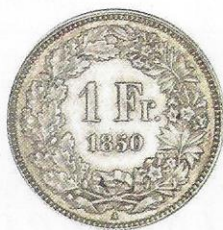
Illustration 1. Revers d'une pièce d'un franc frappée en 1850 avec le poinçon «A», marque de l'atelier monétaire de Paris.

Une première mesure fut de créer une monnaie unique, ce qui fut réalisé en 1848 lorsque la Confédération s'attribua la régale des monnaies. Le franc est divisé dès lors en 100 centimes. Les Alémaniques maintinrent le terme Rappen, dernier vestige des anciennes monnaies. Les premières pièces (5, 2, 1 et ½ franc) furent frappées en 1850 à Paris.