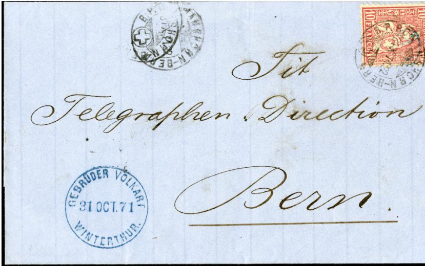
Lettre de Romanshorn pour Berne affranchie à 10cts (Zumstein 38) avec le cachet de l'entreprise « Gebrüder Volkart à Winterthur ».