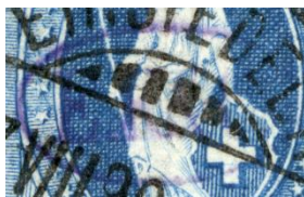
L'agrandissement permet de voir le cachet violet sur le fond bleu

Pour voir l'empreinte sur le dernier document il faut vraiment bien accrocher. Ce qui nous aide est le cachet à gauche en bas du document. Il s'agit d'un cachet privé des « Gebrüder Vollkart AG de Winterthur ». C'est une empreinte ovale de couleur bleu (utilisée de 1870 à 1877) portant les initiales G.V. Elle est bien masquée par l'oblitération