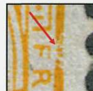
Fig. 4. Vergrößerung des Plattenfehlers

In der Folge haben wir eine dritte Abart auf einer 63Aa gefunden. Es handelt sich um einen Bruch am oberen Teil des Schenkels rechts (E5), den wir in den folgenden Abbildungen darstellen (Abb. 5 und 6). Solch ein Bruch kann leicht übersehen werden, wenn sich dieser auf einer hellen Farbnuance befindet, wie es der Fall wäre auf einer 63Ab.