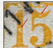
Fig. 8. Vergrößerung des Plattenfehlers