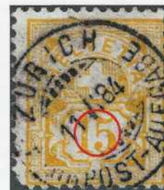
Fig. 7. 63Aa

Eine weitere Marke zeigt einen weissen Punkt auf der Ziffer 1 sowie auf der Ziffer 5 (Abb. 7 und 8). Diese zwei weissen Punkte gleichen der Abart der 5 Rp., 65B auf der 7. Ausgabe, 6. Nachprägung, Nummer 52 nach der Beschreibung von Herrn Raymond Roux (JPhS/SBZ 6 und 7/1987, p. 161). Diese Arbeit ist auf der Webseite des Club philatélique de Delémont et environs ( www.cpde.ch ) für alle einsehbar.