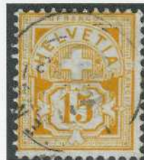
Fig. 3. 57b Stadium 1

In unserem ersten Artikel haben wir einen Bruch im Rahmen auf der rechten Seite neben dem «F» von «FRANCO» (C6-7) auf einer 57b gezeigt (Abb. 1 und 2). Wir haben eine weitere 57b mit quasi demselben Defekt, aber in einem früheren Stadium, entdeckt. Der Bruch ist nicht so ausgeprägt wie auf der ersten 57b. Wie so viele Defekte in dieser Ausgabe werde die Brüche immer grösser. Das Messing-Cliché, ein weiches Metall, nützt sich mit der Zeit ab (Abb. 3 und 4).