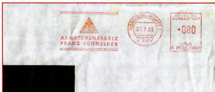
Figure 2a. Lettre postée en Allemagne le 25/7/85.

Il est très curieux de trouver une empreinte de couronne seule, au verso. La réponse à la question de savoir pourquoi, provient d'un autre cas, un peu différent, illustré par les figures 2a et 2b