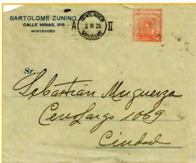
Figure 3. Cette EMA d'Uruguay a été produite par une machine à affranchir de type Universal "NZ", installée au bureau de poste de Montevideo en 1924.

Il y a encore un autre pays qui introduisit une machine à affranchir en 1924 : l'Uruguay.