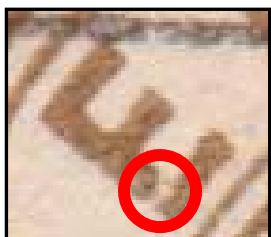
Détail du défaut non recensé

58 B, 6 ème émission (1902-1905), 5 ème réestampage Brisure du E, variété non recensée, et angle inférieur droit étiré variété n° 10, DR 6