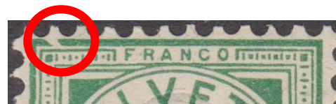
Détail de la variété

65 B, 6 ème réestampage (1905-1906), variété n° 6, DR 8