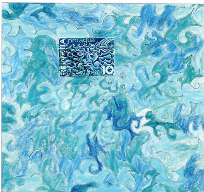
Fig. 1. Ilona, 2003.

Im Zeichenunterricht ging es damit weiter. Ich forderte die Kids auf, Briefmarken aufzukleben und sie mit Farbstiften zu ergänzen. Ich erlaubte ihnen, die Zähnung wegzuschneiden, wenn sie stören sollte. Die Motive durften sie selber wählen. Zwei dieser kleinen Kunstwerke stelle ich Ihnen hier vor.