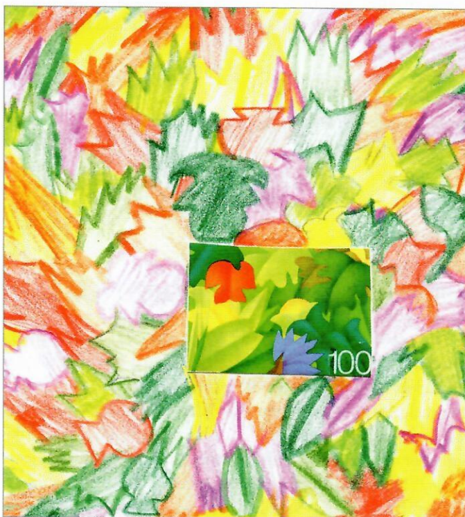
Fig. 2. Alberina, 2005.

Dans le cadre de l'enseignement du dessin, on poursuivait dans le même sens. J'encourageais les enfants à coller des timbres et à les compléter en dessinant avec des stylos de couleurs. Ils pouvaient choisir eux-mêmes les motifs. Je vous présente ici deux de ces petites œuvres d'art.