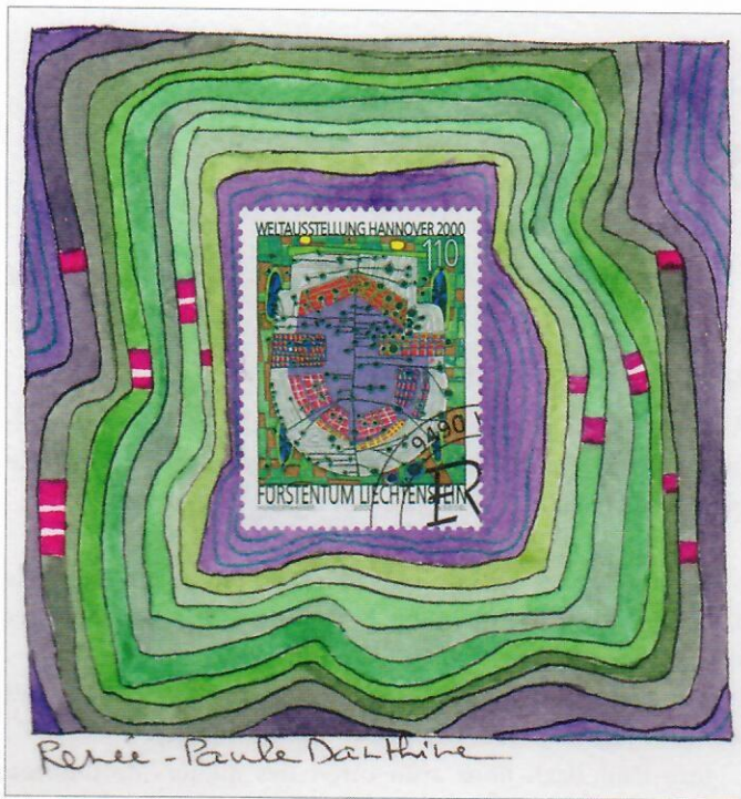
Fig. 3. Renée-Paule Danthine, 2000.

sehr grosser Erfolg beschieden. So etwas hatte man noch nie zuvor in diesen Heiligen Hallen bewundern können.