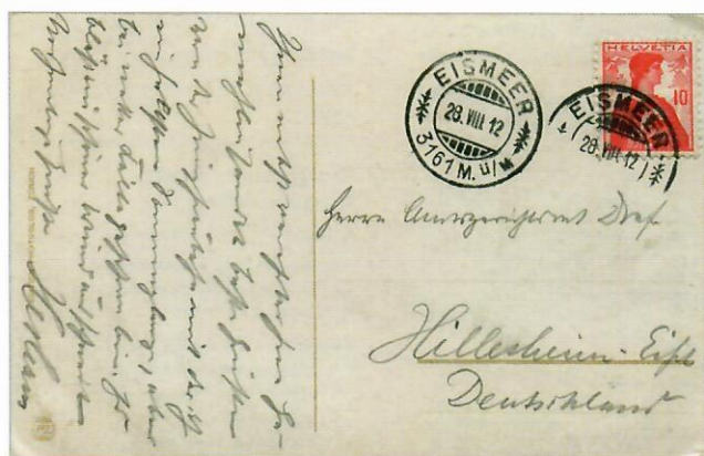
Abb. 3. 1908. Post-Station Eismeer (3161 m).

Im Juni 1903 wurde der Betrieb bis zur Station Eigerwand dem Verkehr übergeben. Zwei Jahre später konnte die Strecke bis zur Haltestelle Eismeer auf 3161 Meter Höhe befahren werden. In dieser Station befand sich ein Touristenzentrum. In einem Restaurant konnten sich die Reisenden stärken.