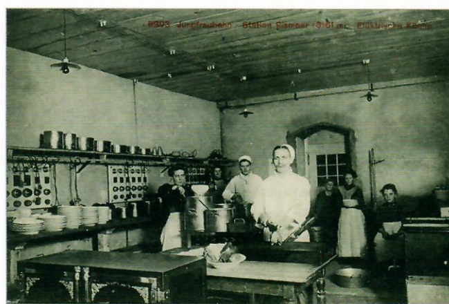
Abb. 2. Die «elektrische Küche». Damals etwas super Modernes.

En juin 1903, le service fut ouvert jusqu'à la station Eigerwand. Deux ans plus tard, le parcours fut ouvert jusqu'à l'arrêt Eismeer située à 3161 mètres d'altitude. A cette station, on avait installé une sorte de «centre pour les touristes». Dans un restaurant, les touristes pouvaient se restaurer et reprendre des forces.