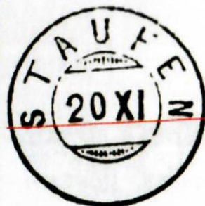
cachet Güller 905, cachet nain Grp. 138

Come si può notare, è necessario esaminare attentamente i francobolli. Quando si trovano pezzi del genere, si rimane impressionati e si ha la tendenza a volerli