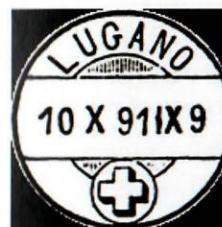
Güller 355 1869

Wie beim Stempel aus Morges sind die Inschriften „BRF. EXP.“ im Original nicht zu finden.