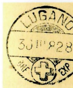
Stempel aus dem Fournierbuch