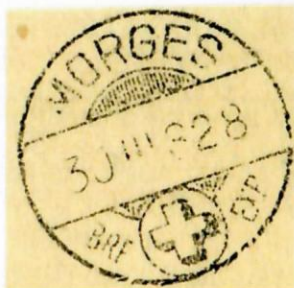
Stempel aus dem Four- nierbuch