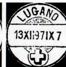
Güller 1719 1874