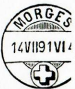
Güller 1292 1872