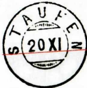
Güller-Stempel 905 Zwergstempel (Gruppe 138)

Wie Sie sehen, muss man die Stempel genau untersuchen.