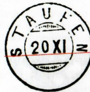
Fälschung Güller-Stempel Nr-905 Zwergstempel (Gruppe 138)

La comparaison des cachets, Güller versus falsification, permet de constater les différences, comme vous pouvez le voir dans l'illustration suivante. Comme vous le voyez,