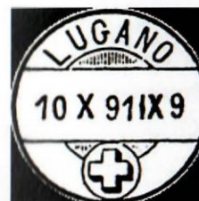
Güller 355 1869