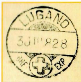
Stempel aus dem Fournierbuch