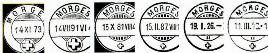
Güller 34 1867

Sie können die Unterschiede sofort erkennen, der Güller-Originalstempel hat die Inschrift „BRF. EXP.“ nicht. In der Folge zeige ich euch die chronologische Verwendung der verschiedenen Stempel aus Morges.