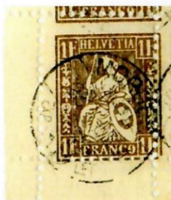
Fournier-Fälschung mit starker Verzähnung

Le differenze si riconoscono subito: il timbro originale Güller non presenta la scritta "BRF. EXP.". Di seguito, vi mostrerò l'uso cronologico dei vari timbri postali di Morges.