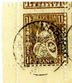
Fournier-Fälschung mit starker Verzähnung

Sie können die Unterschiede sofort erkennen, der Güller-Originalstempel hat die Inschrift „BRF. EXP.“ nicht. In der Folge zeige ich euch die chronologische Verwendung der verschiedenen Stempel aus Morges.